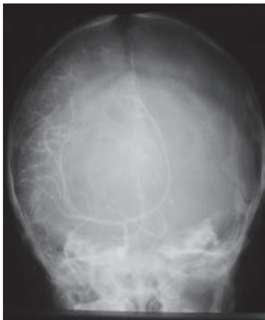
Рис. 1. Каротидная ангиограмма. Симптом «бокала».

тоз (чаще нейтрофильный), в других – гиперальбуминоз, в третьих – нормальный состав. Следует отметить, что при подозрении на внутричерепную гематому или АГМ (особенно височной доли) люмбальная пункция может спровоцировать развитие синдрома вклинения.