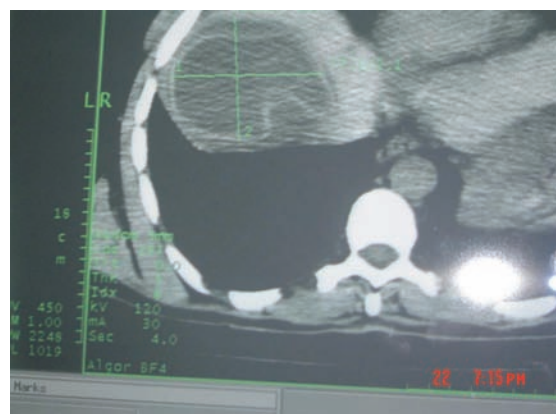
Рис. 2. Томограмма печени эхинококковой кисти.