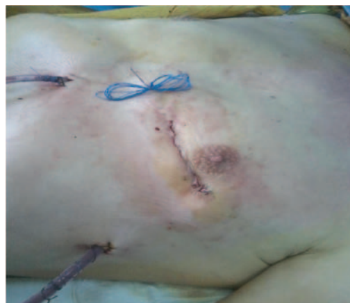
Рис. 2. Внешний вид грудной клетки после операции

бинация ВГА и аутовены была у 12 (16,9%) пациентов. У 7 оперированных полная артериальная реваскуляризация левого желудочка посредством комбинированно-секвенциального шунтирования при помощи ВГА и ЛА сочеталась с чрескожным коронарным вмешательством (ЧКВ) в бассейне ПКА. Показанием к использованию данного способа гибридной реваскуляризации миокарда служило трехсосудистое поражение коронарных артерий с возможностью ЧКВ в системе ПКА при ее неадекватной интраоперационной визуализации и позиционировании, наличии повышенного риска искусственного кровообращения или высокой вероятности развития конкурирующего кровотока в системе ПКА при ее реваскуляризации из левой ВГА. У 2 пациентов часть основного этапа операции выполнялись на вспомогательном кровообращении без остановки сердца. При этом в одном случае при-