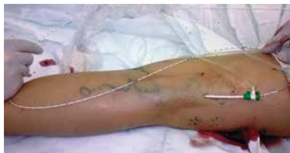
Рис. 3. ЭВЛК несостоятельной вены Джаакомини.

С целью защиты окружающих тканей и повышения степени контакта венозной стенки с рабочей частью лазерного световода выполняли тумесцентную анестезию по стандартной методике раствором Кляйна [12]. Лазерную коагуляцию выполняли при постепенном извлечении световода под ультразвуковым контролем. Происходила равномерная коагуляция стенки вены, и уменьшалась травматизация окружающих вену тканей.