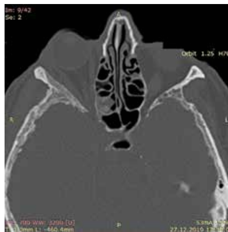
Рис. 3. Компьютерная томография орбит пациента М. в аксиальной плоскости. Опухолевое поражение костей свода и лицевого отдела черепа.

Для облегчения доступа к опухоли была использована навигационная система. Интраоперационно произведено наложение 3D-модели черепа на пациента с сопоставлением по носовым костям и краям орбиты (рис. 5). Произведен разрез кожи в наружном отделе. Поднадкостнично доступ в орбиту в зоне визуальной проекции опухоли. Взята биопсия.