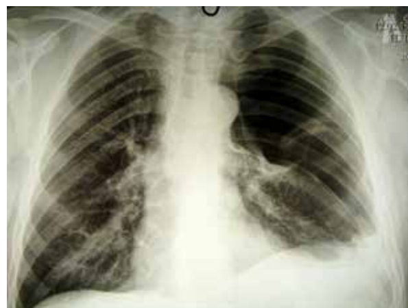
Рис. 1. Рентгенограмма грудной клетки пациента. Левое легкое поджато воздухом, в плевральной полости дренаж.

Послеоперационный период протекал без осложнений, дренажи удалены на пятые сутки после операции. При рентгеновском исследовании легкие расправлены, на 12-е сутки выписан из стационара.