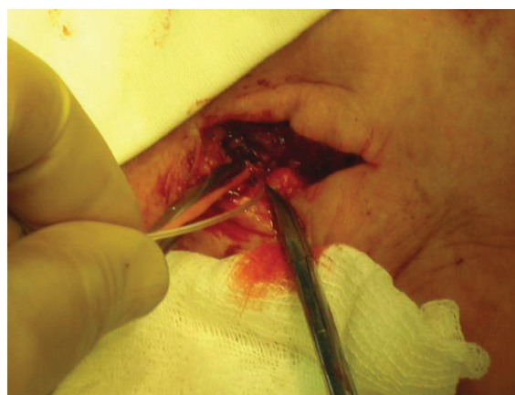
Рис. 3. Этап дистанционной окклюзии задних большеберцовых вен. Введение аутовены в просвет задних большеберцовых вен.