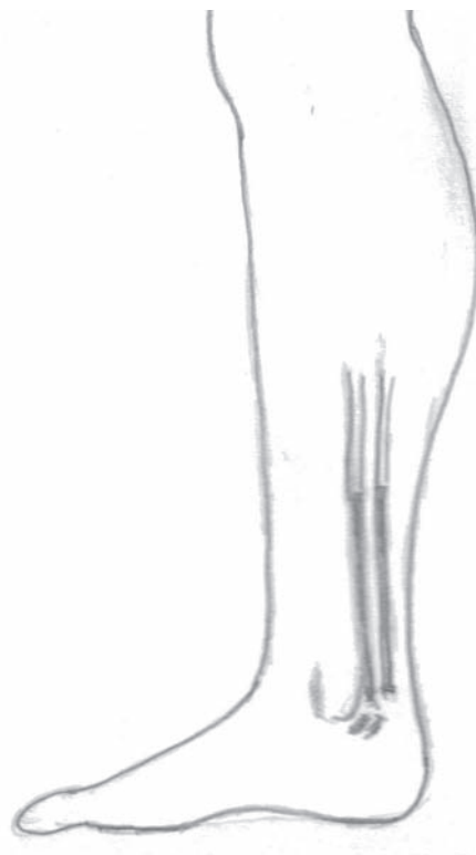
Рис. 1. Схема операции – дистанционная окклюзия задних большеберцовых вен. Аутовеной обтурированы дистальные отделы задних большеберцовых вен.

Операция в третьей группе выполнялась в следующей последовательности. После удаления большой подкожной вены на бедре, позади медиальной лодыжки