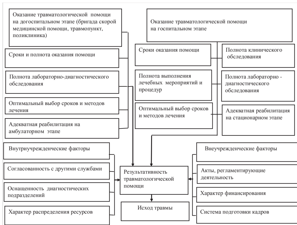
Схема 1. Факторы, влияющие на достижение этапной результативности травматологической помощи.