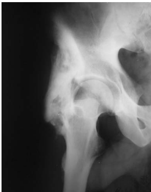
Рис. 3. Оссифицирующий миозит по наружной поверхности правого тазобедренного сустава. Зрелая стадия.

мя дорожно-транспортного происшествия около одного года назад. Лечился в центральной районной больнице консервативно с помощью различных физиотерапевтических процедур, в т.ч. и тепловых. Межмышечная гематома не вскрывалась.