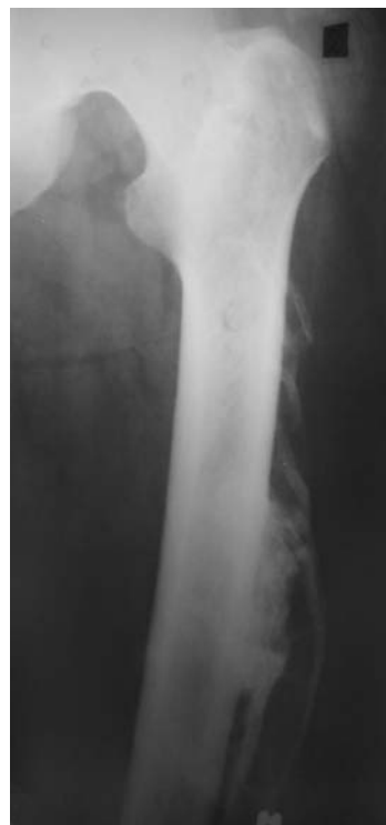
Рис. 2. Зрелая стадия ОМ у пациента через 1 год после тупой травмы мягких тканей бедра во время игры в футбол.

Больной Л., 30 лет, поступил в клинику с жалобами на ограничение отведения правого бедра и уплотнение мягких тканей по наружной поверхности правого тазобедренного сустава. В анамнезе травма во вре-