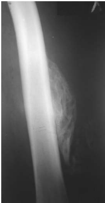
Рис. 1. Незрелая стадия ОМ у пациента после обширной гематомы по наружной поверхности бедра, образовавшейся вследствие тупой травмы во время игры в футбол.

участками разряжения и уплотнения (рис. 1).