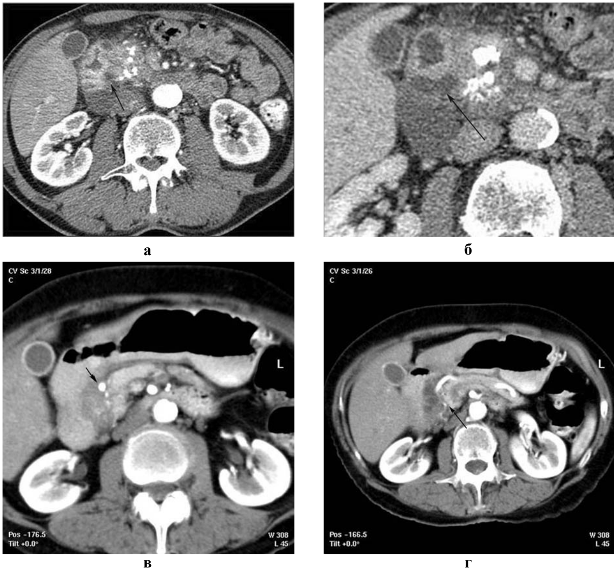
Рис. 1 а. КТ с контрастированием. Артериальная фаза. Увеличение головки ПЖ с множественными кальцинатами в ее структуре. Стрелкой указана киста в медиальной стенке 12-перстной кишки, деформирующая просвет последней; 1 б. Венозная фаза. Контрастирование двенадцатиперстной кишки водой после введения атропина. Стрелка – киста в стенке суженной вертикальной ветви; 1 в. Артериальная фаза. а. gastrodudenalis смещена медиально и проходит в борозде между кистозно-измененной стенкой двенадцатиперстной кишки и головкой ПЖ (стрелка); 1 г. Артериальная фаза. Четкая граница между пораженной и неизменной тканью головки ПЖ (тонкая стрелка).

знаком ДД при КТ и МРТ является пристеночное фиброзное уплотнение, проявляющееся слоем компактной ткани между просветом двенадцатиперстной кишки и ПЖ. По сравнению с параметрами ПЖ эта тканевая пластина имеет одинаковую плотность при КТ и одинаковую интенсивность при МРТ 1 – взвешенном изображении до контрастирования. В фазу панкреатическо-