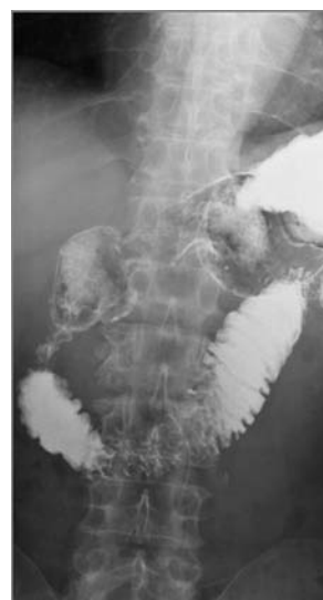
Рис. 3. Рентгенография желудка с барием. Определяется выраженный стеноз вертикальной ветви двенадцатиперстной кишки, расширение желудка и луковицы ДПК.

взвешенной последовательности, что отличает изображение патологических тканей от ткани ПЖ. В венозную и позднюю фазы контрастное усиление позднее и редуцированное, по сравнению с паренхимой ПЖ изображение повышенной плотности при КТ и повышенной интенсивности при МРТ.