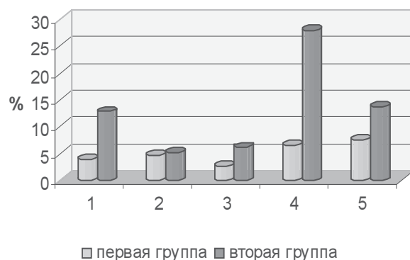
Рис. 1. Прирост исследуемых гемодинамических показателей на этапе удаления матки по отношению к дооперационному уровню у больных обеих групп 1-САД; 2-ДАД; 3-АДср; 4-ДП; 5-ЧСС

Как показано на рисунке 1, применение бемитила в комплексной предопера-