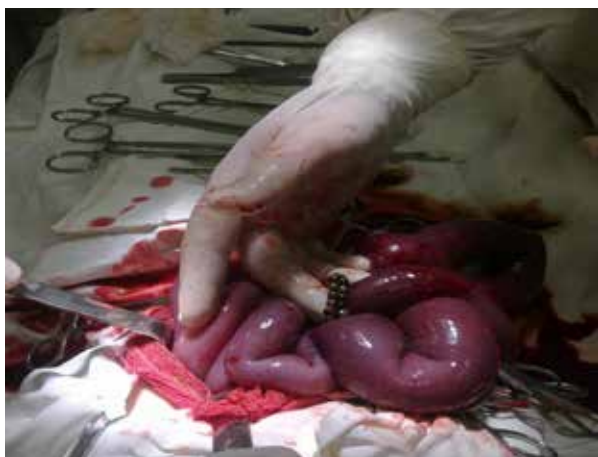
Рис. 1. МИТ, перфорировавшие подвздошную кишку

Пациент 2 лет госпитализирован 28.09.2014г., через 3 часа с момента проглатывания МИТ. Мама заметила, что ребенок проглотил неодимовые шарики от конструктора. При поступлении выполнена обзорная рентгенограмма брюшной полости, на которой выявлено 15 МИТ, расположенных цепочкой в пищеводе и желудке (рис. 3). Под эндотрахеальным наркозом выполнена ФГДС, при которой с большим трудом, так как часть магнитов, попавших в желудок, притянулись к тем, что были в пищеводе, и зажали угол Гиса, были извлечены МИТ. Через сутки выписан домой.