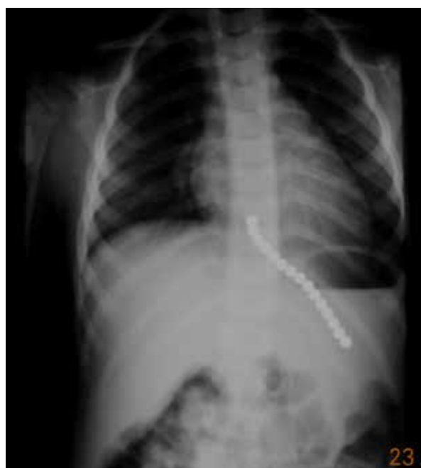
Рис. 3. Обзорная рентгенограмма брюшной полости мальчика 2 лет