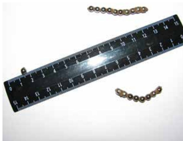
Рис. 2. МИТ, извлеченные из просвета подвздошной кишки

Лечебная тактика при проглатывании магнитных шариков зависит от локализации, времени с момента их попадания в просвет пищеварительного канала и наличия осложнений. При фиксированных магнитах в пищеварительном канале тактика должна